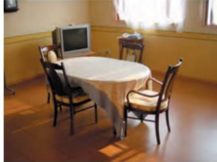
プレママのお勉強&ティーラウンジ 陽だまりルーム