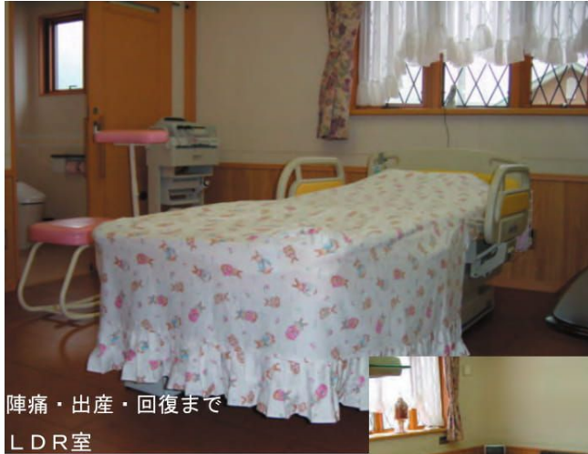
陣痛・出産・回復まで LDR室