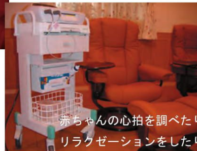
赤ちゃんの心拍を調べたり リラクゼーションをしたり