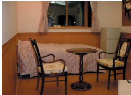
入院室 (ファミリールーム)