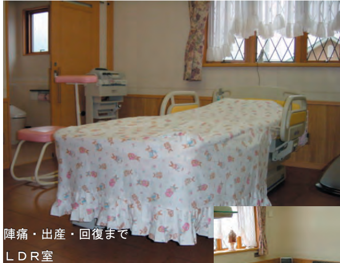
陣痛・出産・回復まで LDR室

赤ちゃんの誕生は かけがえのない喜びです あどけない表情は たくさんの幸せを 運んでくれるでしょう いちろうクリニックでは 妊娠から出産までの時期が 最高の思い出となりますように 最新の医療技術をはじめ 経験豊かな医師・スタッフが まごころを込めて赤ちゃんとお母さんを応援します