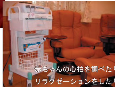
赤ちゃんの心拍を調べたり リラクゼーションをしたり