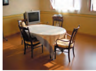
ブレママのお勉強&ティーラウンジ 陽だまりルーム